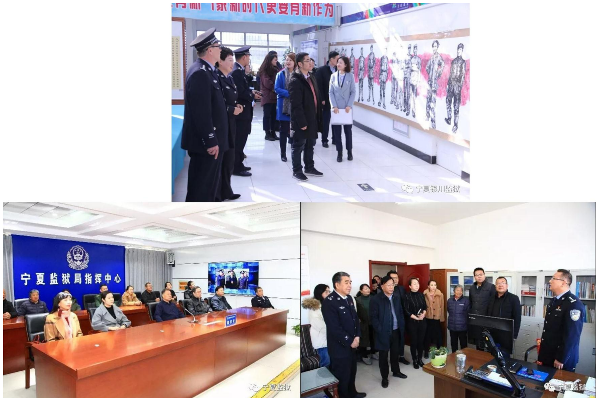
图1 全区监狱各单位组织“开放日”活动

（一）严格落实“五公开”。认真执行中央、自治区有关文件精神，全面落实狱务公开“双清单”，做到决策、执行、管理、服务、结果等全过程公开。不断创新狱务公开方式方法，拓宽狱务公开渠道，使罪犯近亲属和社会公众能够更加方便、快捷地获得公开信息。及时在门户网站公开部门预算和决算和假释、暂予监外执行法律文书。常态化开展监狱“开放日”活动，邀请服刑人员家属、媒体记者、人大代表、政协委员和执法监督员走进监狱，做好社会帮教工作，主动接受社会监督。2019年，全区监狱各单位共开展“开放日”活动18次，公开假释、暂予监外执行法律文书5件。