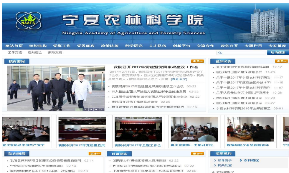
宁夏农林科学院门户网站截图